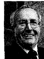
L'amm. del. Divo Gronchi